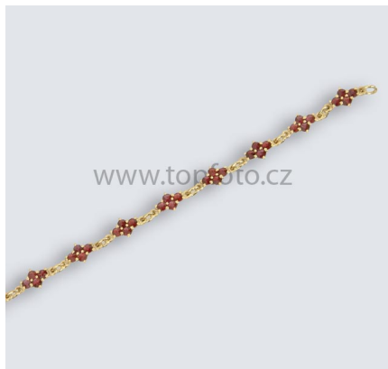
Strieborný náramok s polodrahokamom českým granátom